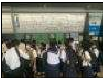
【各班に分かれて事業所へ】

この東京校外学習を通して、2年生が一回り成長した姿を見せてくれるのが楽しみです。