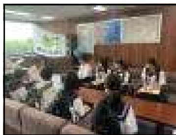
【職場訪問：国土地理院】