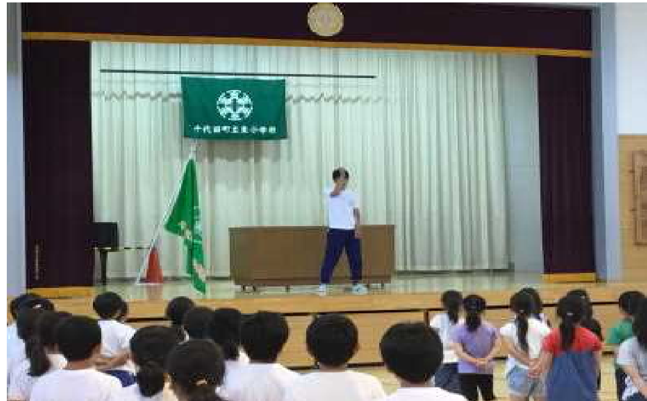
代表者の式に合わせて「おお牧場はみどり」を歌いました