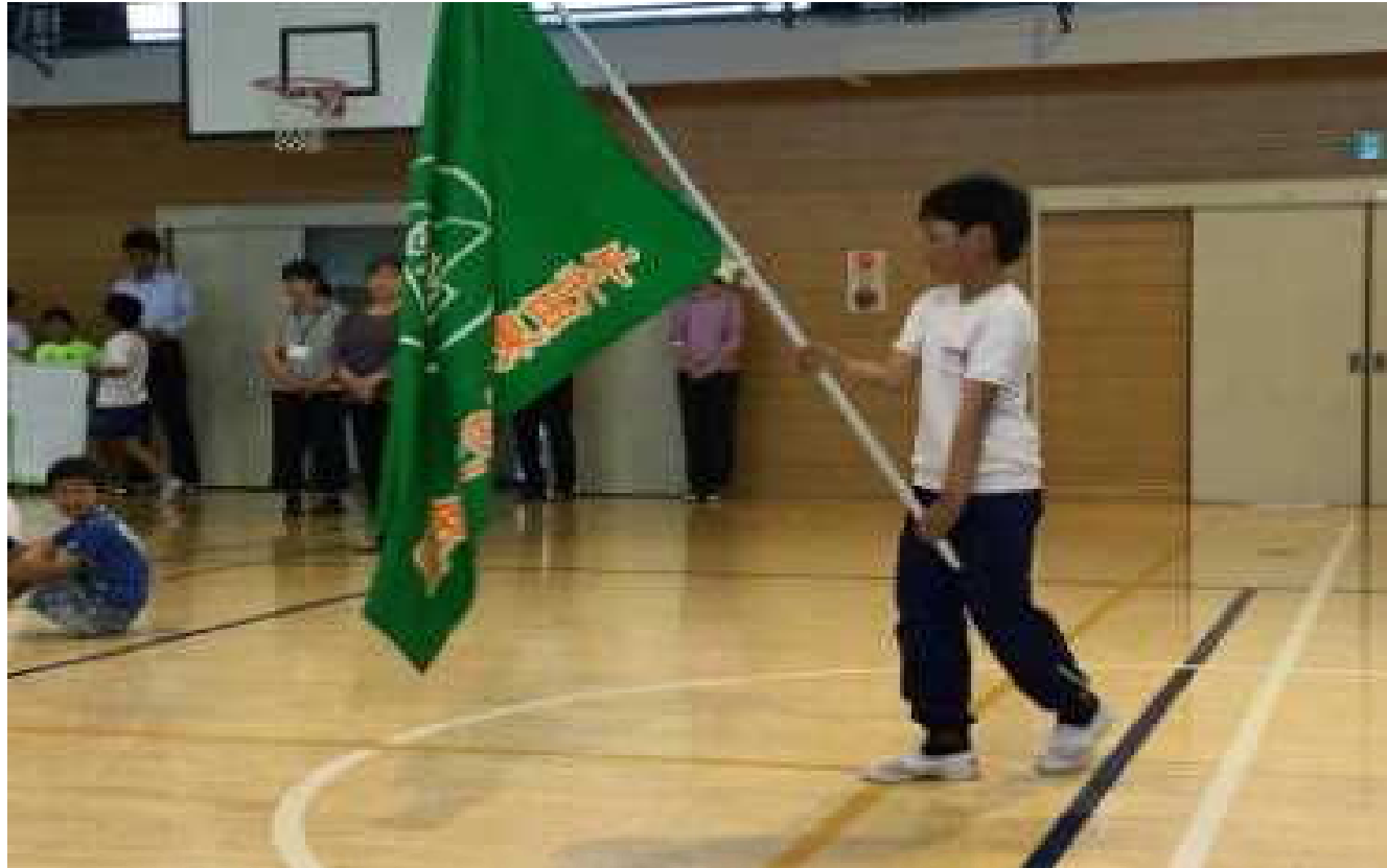
緑の少年団の団旗を持って堂々と入場する代表者

5月30日の朝行事で「緑の少年団 結団式」を体育館で行いました。緑化委員会が式を進行しました。