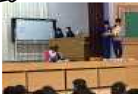
いじめられて泣いている子

11月27日（水）に児童会本部役員の司会でいじめ防止集会が行われました。最初にクラスの代表者がいじめがなくなるためにどうすれば良いかを発表しました。その後、児童会役員を中心とした子どもたちによる『いじめが起きないようにするための劇』を行いました。劇の中では、東小の『ケヤッピー』も登場し、子どもたちにわかりやすく語りかけていました。これを機会に東小からいじめがなくなり、『群馬県一素敵な小学校』に近づいていくことを期待しています。