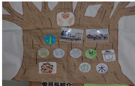
東小『思いやりの木』