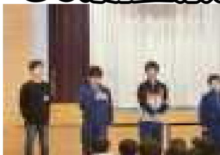
6年生から発表しました