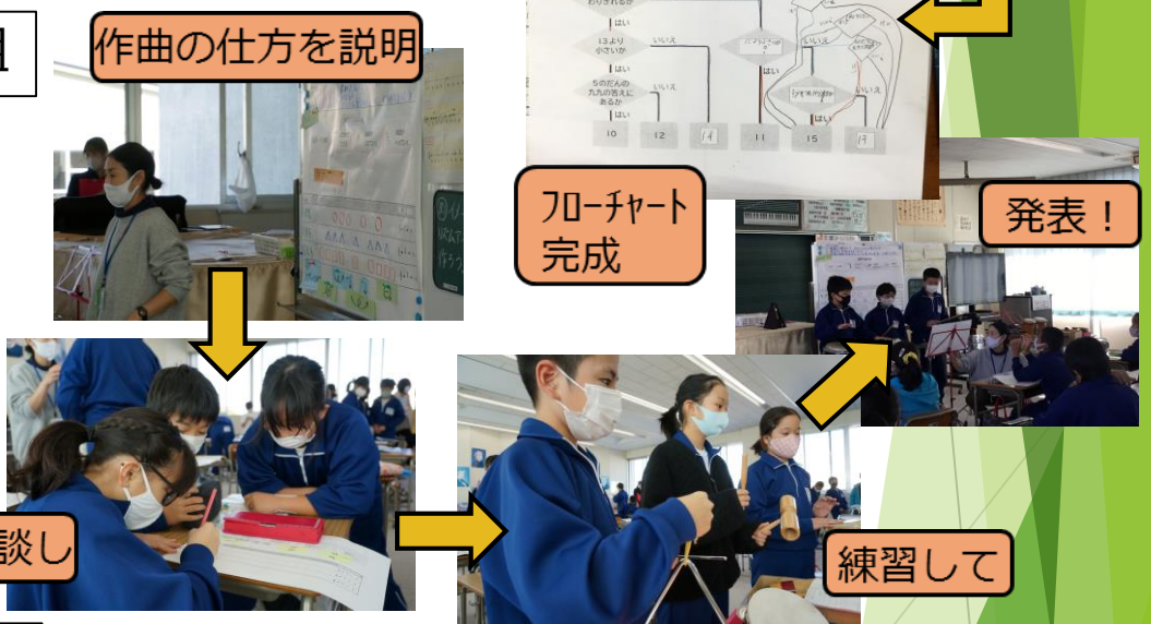
グループで相談し

打楽器でリズムアンサンブルを作ることとおして、プログラミングの原理を学習しました。