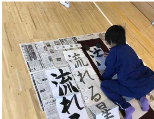
先生のお手本を真剣に見る3年生! 『すごい!』