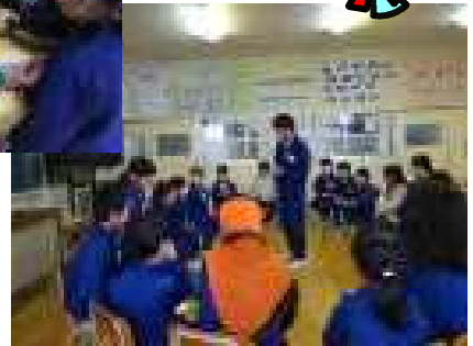
5年生中心の縦割り班活動