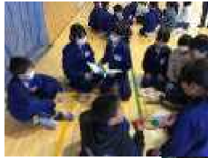
縦割り班ごとにプレゼント

翌日、体育館で全校の送る会を開催しました。1年生が手をつないで入場し、その後、縦割り班ごとに2年生が作った首飾り、みんなで書いたメッセージカードをプレゼントしました。各学年ごとに分担が決まっています、それぞれの学年が心を込めて準備しました。会の進行は、新本部役員が行いました。そして、全校合唱「君と君と君と」から始まり、職員の出し物「東魂ソーラン先生の舞」、6年生の出し物「1年生から6年生までの思い出」と、とても楽しい時間を過ごすことができました。