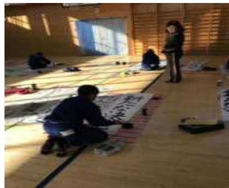
六年生 「新たな決意」