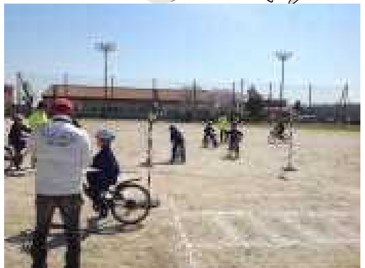
3年生 自転車の実地訓練