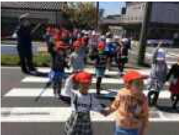
1, 2年生横断歩道の渡り方実地訓練

交通講話の後、1, 2, 3, 5年生は実地訓練をしました。1, 2年生は、学校周辺の道路の歩き方や、上五箇や美濃里の信号機のある横断歩道の渡り方を学習しました。3, 5年生は、校庭の模擬道路で自転車の正しい乗り方について学びました。ヘルメットを正しくかぶり、右折左折の仕方、狭い道路から広い道路への出方などを指導員さんから丁寧に教えてもらいました。特に、3年生はこの交通安全教室実施後、「東小のよい子」にあるように東小学区内を自転車で乗ることができます。交通ルールを守って、事故のないように乗ってほしいです。保護者の皆さんも、お子さんが自転車に乗る際には、「事故に気をつけて」の声かけをお願いします。